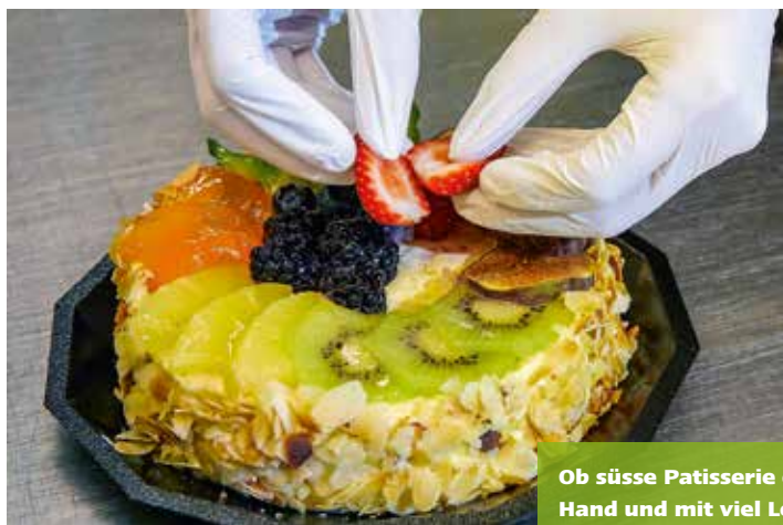
Ob süsse Patisserie oder knuspriges Brot: In den Coop-Hausbäckereien wird beides von Hand und mit viel Leidenschaft hergestellt.

schauen. Und selbst am Abend finden Kunden noch ofenfrische Brotwaren. «Wir können rasch reagieren, wenn Produkte ausverkauft sind», sagt Zahler. Auch in Sachen Patisserie trumpft die Coop Hausbäckerei auf. Individuelle Torten zum Geburtstag, zur Hochzeit oder zu einer Party – Kunden können ihre Wünsche direkt mit dem Konditor vor Ort besprechen. Dabei versucht man, selbst ausgefallene Wünsche zu erfüllen. «Wir haben schon eine vierstöckige Hochzeitstorte in Herzform angefertigt.»