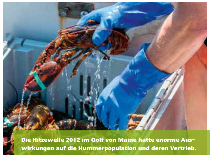
Die Hitzewelle 2012 im Golf von Maine hatte enorme Auswirkungen auf die Hummerpopulation und deren Vertrieb.