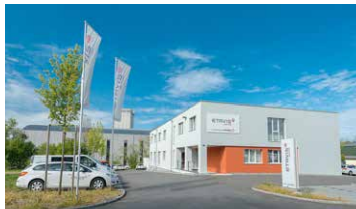
Der Hauptsitz der ETAVIS Beutler AG in Burgdorf.

Weiter befinden sich auf den Dächern der Maschinenhalle und des Strohlagers insgesamt vier grosse Photovoltaikanlagen, die jährlich eine Strommenge von rund 430'000 kWh produzieren.