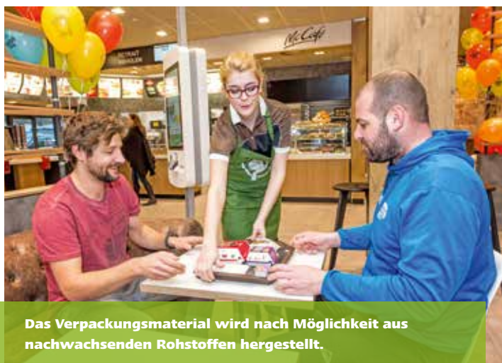
Das Verpackungsmaterial wird nach Möglichkeit aus nachwachsenden Rohstoffen hergestellt.

Um die Transportwege kurz zu halten und wegen der Qualität der Schweizer Produkte bezieht McDonald's 86% seiner Zutaten aus dem Inland. Rund 10'000 Schweizer Bauern gehören zu den Partnern des Gastronomieunternehmens. Über 70% des verwendeten Rindfleischs stammt von Kühen, die regelmässigen Auslauf ins Freie erhalten – der dabei angewandte RAUS-Standard übertrifft die von der Schweizerischen Tierschutzgesetzgebung vorgegebenen Anforderungen deutlich. Bei den französischen und ungarischen Pouletfleisch-Lieferanten achtet McDonald's darauf, dass in Bezug auf Haltung, Fütterung und Besatzdichte die Schweizer Tierschutzstandards eingehalten werden. Eine nachhaltige Produktionsweise ist ein entscheidendes Kriterium für alle importierten Produkte. Für Kaffeegetränke verwendet das Unternehmen Bohnen mit dem Fairtrade-Label der Rainforest Alliance. Die panierten Hokifischfilets des Filet-O-Fish tragen das Gütesiegel des Marine Stewardship Councils (MSC). Die Shrimps erfüllen den Standard des Aquaculture Stewardship Councils (ASC), der eine nachhaltige Fischzucht garantiert.