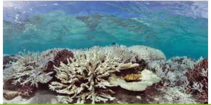
Korallen verlieren bei anhaltendem Hitzestress ihre leuchtenden Farben und bleichen aus.

im Wasser verändern. Ein Beispiel ist der «Blob», eine lang andauernde Hitzewelle im nordöstlichen Pazifik zwischen 2013 und 2015. Diese Hitzewelle entstand aufgrund einer atmosphärischen Störung, der sogenannten Omegalage, die sich durch Rückkopplungseffekte der warmen Oberflächentemperatur verstärkte. Auch die Hitzewelle in Europa im Jahr 2003 führte zu einem starken Temperaturanstieg im Mittelmeer.