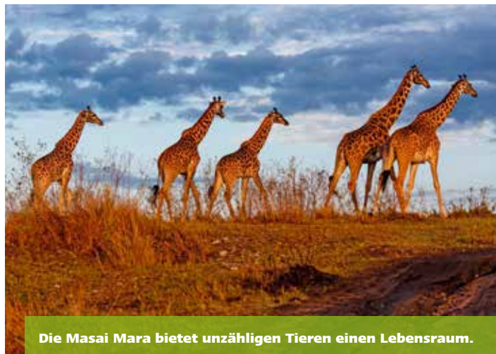
Die Masai Mara bietet unzähligen Tieren einen Lebensraum.

Bewirtschaftung ihres Lebensraums sensibilisiert werden. Durch Audits vor Ort wird das Projekt begleitet und dessen Wirksamkeit kontinuierlich überprüft. Mit ihrem Engagement in Kenia will Ypsomed den eigenen CO 2 -Ausstoss durch gesteigerte Produktionsvolumen und Expansion ein Stück weit kompensieren und einen Beitrag leisten, um die Artenvielfalt in der Masai Mara zu erhalten.